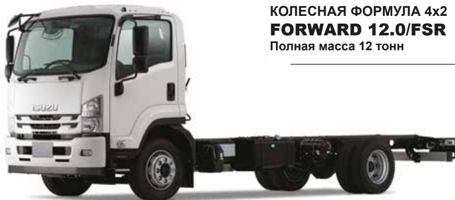
КОЛЕСНАЯ ФОРМУЛА 4x2 FORWARD 12.0/FSR Полная масса 12 тонн

Важными отличительными чертами современных грузовых шасси ISUZU FORWARD являются экономия топлива и экологичность.