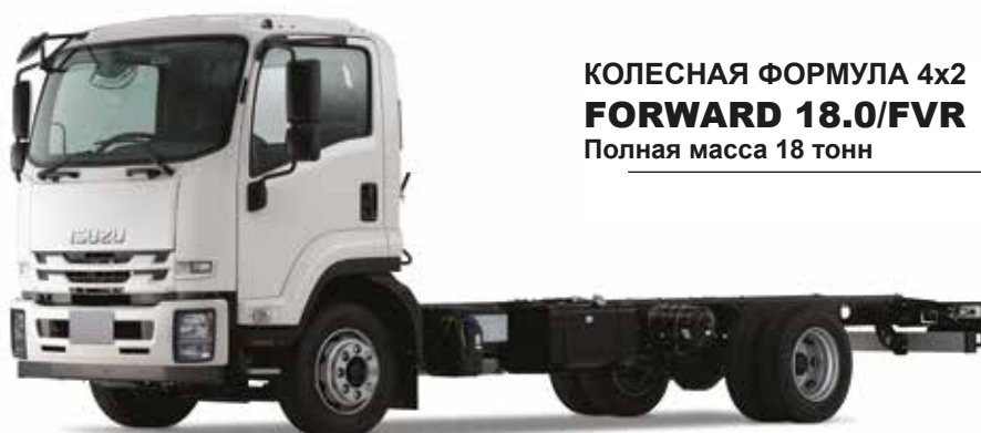
КОЛЕСНАЯ ФОРМУЛА 4x2 FORWARD 18.0/FVR Полная масса 18 тонн